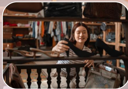
屏東在地特色產業 (農業、百工職人等)