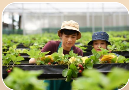
食農/食漁教育 體驗