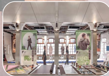
數位內容策展 (屏東產業)