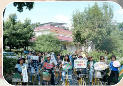
社區/學校導覽結合