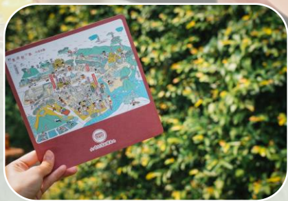
在地故事遊戲 體驗