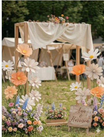
圖 2 入口意象示意圖