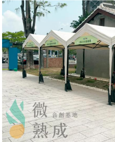
圖 3 帳棚款式

此外，拍照區周邊將規劃畢業×創業互動區。現場設置具備畢業感言與創業精神共鳴之視覺板材供民眾互動拍照，旨在強化校內創業團隊（如 U-start 團隊）與畢業生之情感連結。本次活動更跨界邀請緯來電視台《Shark Tank》節目部進駐宣傳，透過媒體資源引進，將創業熱忱轉化為實質的職涯延伸與曝光機會，達成產學共好之目標。