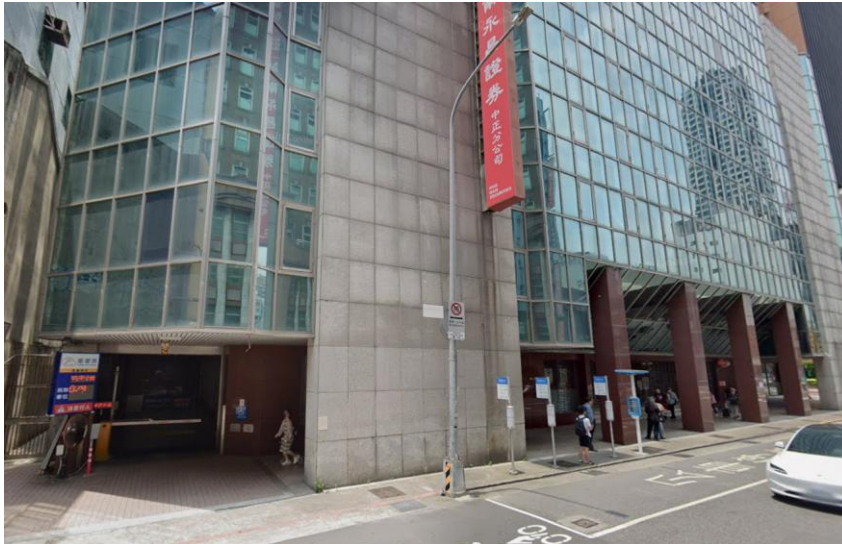
Times 台灣聯通停車場-重慶場實景圖