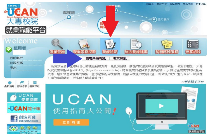
圖 2：請依箭頭指示點選「職能診斷：職場共通職能」