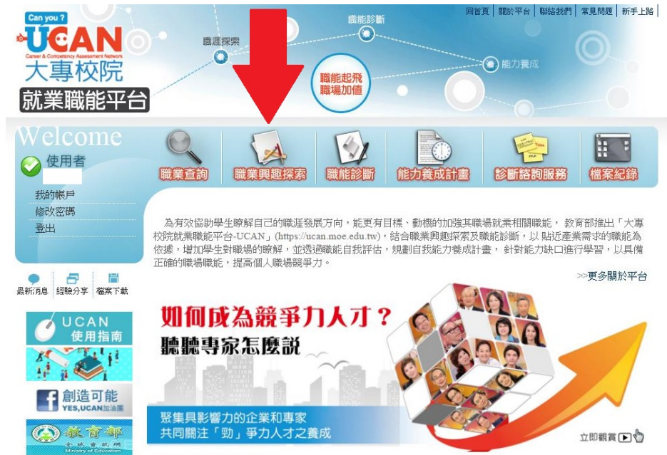
圖 1：請依箭頭指示點選「職業興趣探索」