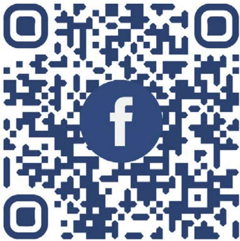
計畫 FACEBOOK 網頁連結