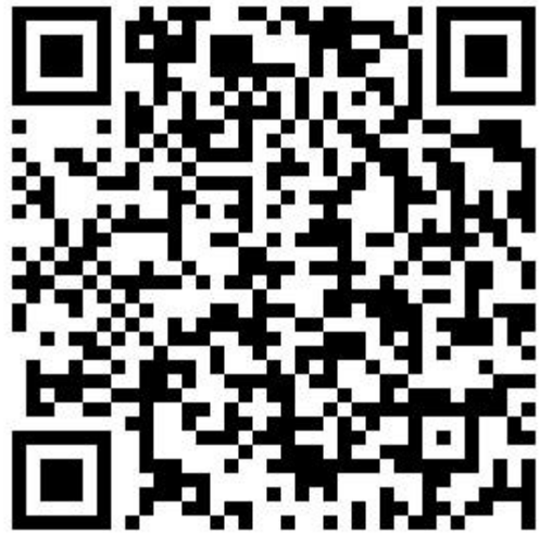
108 年度計畫招生簡章下載連結