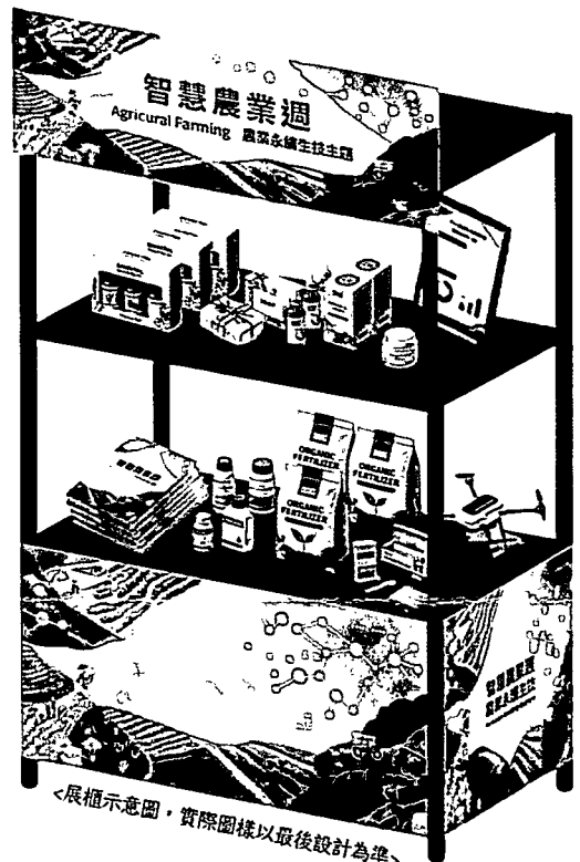
<展櫃示意圖，實際圖樣以最後設計為準>

報名只到 6/18(四)， 將依繳費順序開放選位， 機會難得、絕對超值，不要錯過！